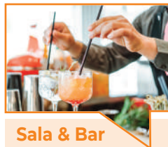
Sala & Bar